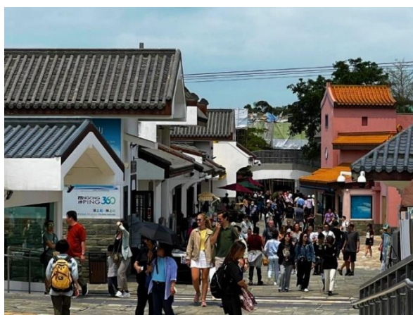
昂坪 360 於 2023 年五一勞動節的訪客量，創出疫情以來新高。