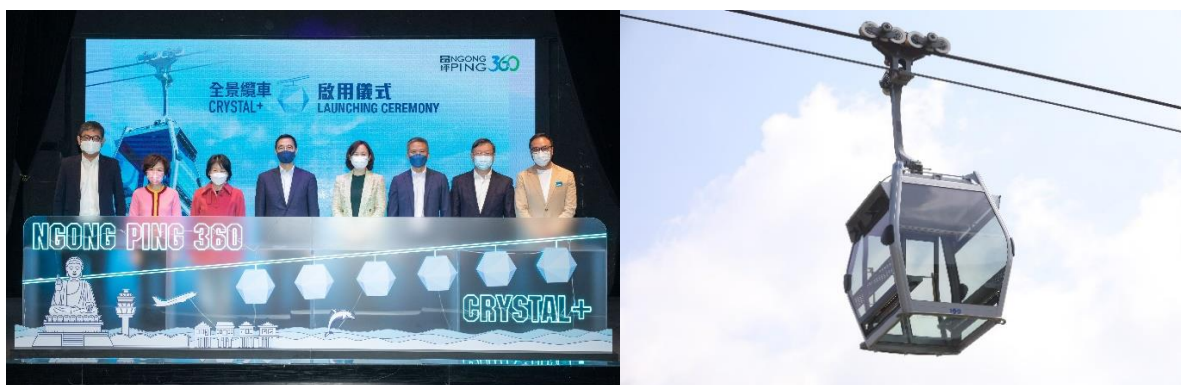
昂坪 360「全景纜車 Crystal+」於 2022 年 12 月 10 日耀目登場。