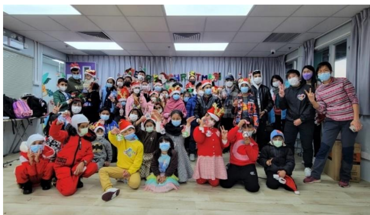
昂坪 360 於 2022 年 12 月聯同鄰舍輔導會少數族裔支援服務中心，為區內少數族裔小朋友舉辦聖誕聯歡會。