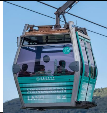
恒基兆業地產集團